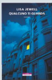
LISA JEWELL QUALCUNO TI GUARDA

«Un thriller che ti afferra per la gola».