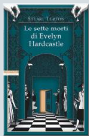
STUART TURTON LE SETTE MORTI DI EVELYN HARDCASTLE

«Da capogiro... abbagliante come il finale di uno spettacolo di fuochi d'artificio».