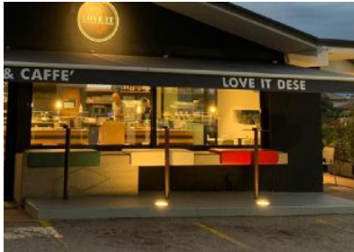
Il nuovo flagship «Love It» inaugurato a Desenzano del Garda